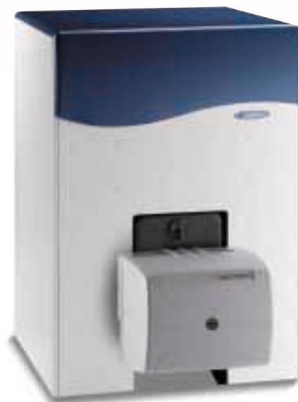
Modèle avec brûleur Silver Top